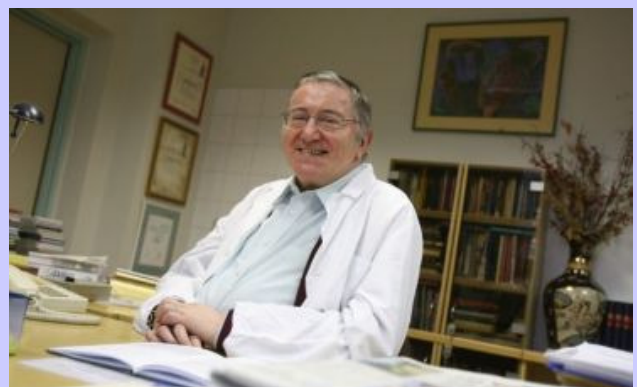
Za delovno mizo