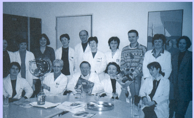
V družbi sodelavcev ob svoji 60. letnici